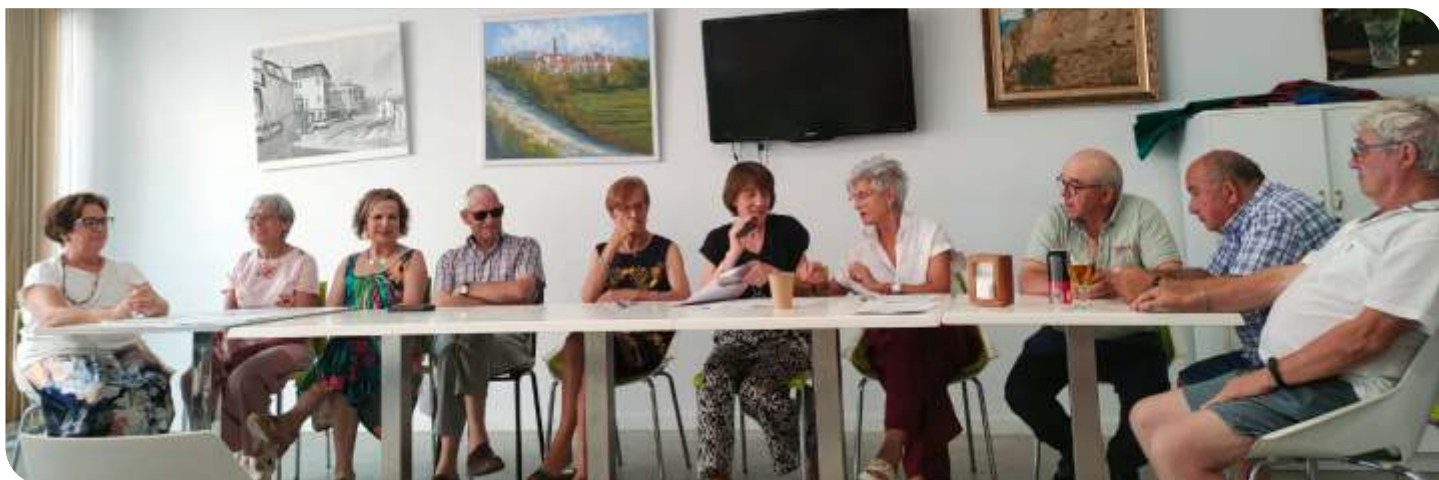
Junta directiva actual de la Asociación "Hogar del Jubilado"